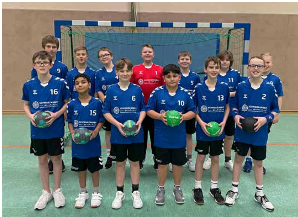
Text/Foto: Michael Möbius